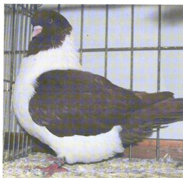
Strasser rouge mâle