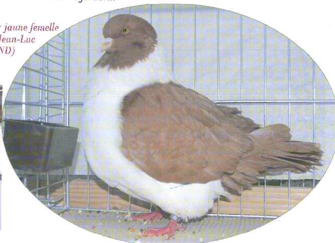
Strasser jaune femelle

Il se surprend à leur parler... Dans tous les cas, s'ils ne lui répondent pas au moins auprès d'eux il trouve la détente et le repos recherché.