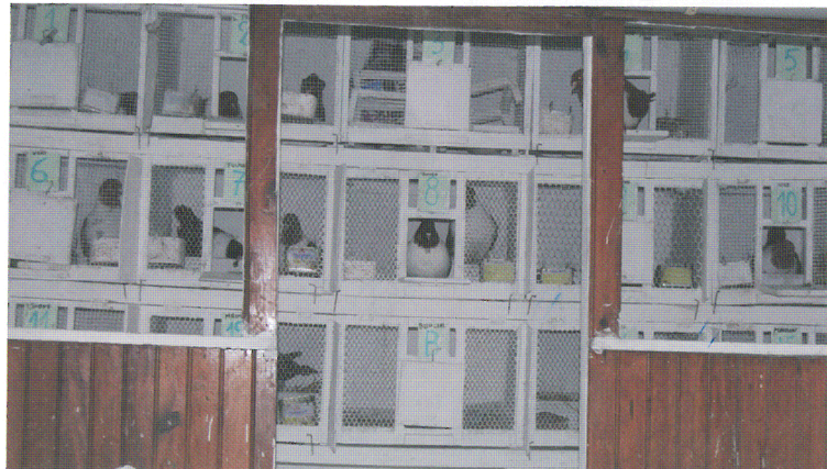
Les cases des Strasser