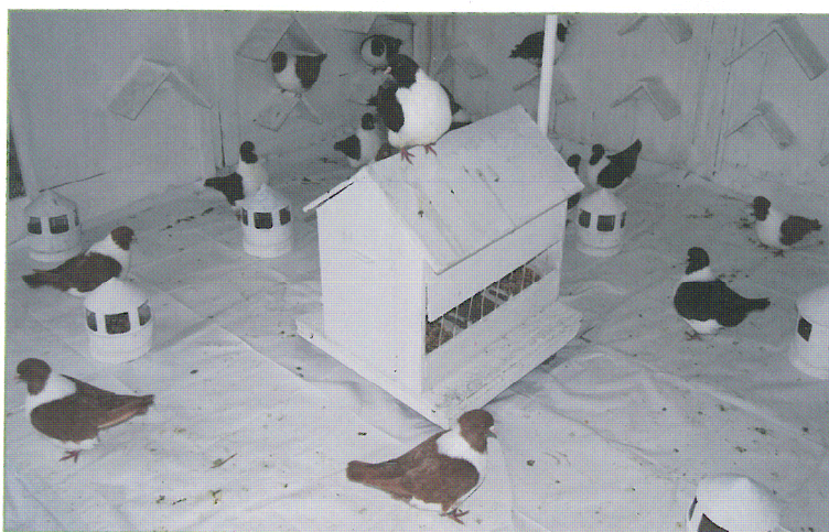
Pour couvrir le sol de ses volières, Jean-Luc utilise des affiches publicitaires du Métro parisien !